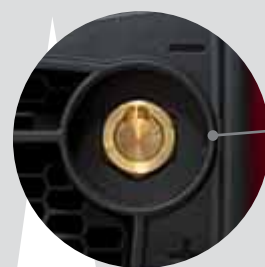
Ø 50 mm socket Presa Ø 50 mm