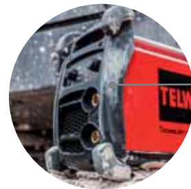
Anti-shock bumpers Paraurti antishock