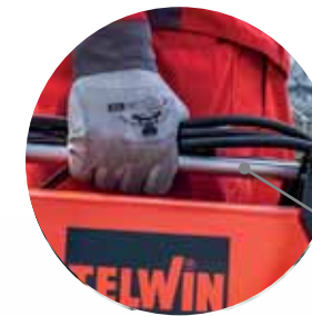
Metal handle Maniglia in metallo