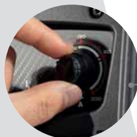
Simple adjustment Regolazione semplice